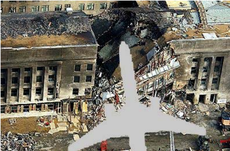
Bild 7: Das teilweise zerstörte Pentagon-Gebäude im Größenverhältnis zu einer Boeing 757

Das Gebäude hat ein Höhe von ca. 23 Metern. Eine Boeing hat eine Spannweite von ca. 37 Metern.