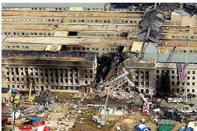
Bild1: Der zusammengestürzte Teil des Pentagons. so wurde es meist in der Weltpresse gezeigt.

Zusammenfassung aus einer Veröffentlichung von Thierry Meyssan auf der französisch-sprachigen Website 'www.asile.org'