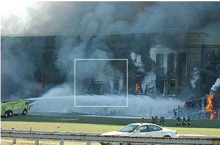
Bild 2: Die Front des Pentagon-Gebäudes in den Minuten unmittelbar nach dem Angriff. Gebäudestruktur noch intakt. Es sind keine Flugzeugtrümmer zu sehen!

einer Rakete mit Flügeln glich. "Es war wie eine Cruise Missile mit Flügeln" ("It was like a cruise missile with wings")