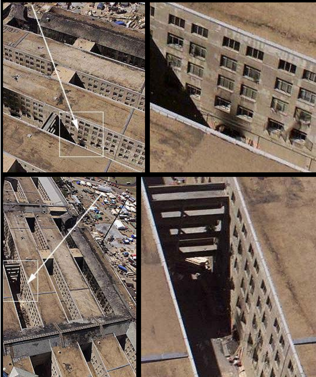
Bild 6: Flugbahn des Objekts, das die drei Gebäude-Ringe durchdrang, und die Austrittsöffnung aus einer anderen Perspektive (rechts im Ausschnitt vergrößert)