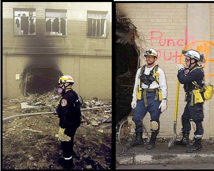
Bild 3 und 4: Die Austrittsöffnung, rechts (in Bild 4) nach Beseitigung der Trümmer

Bild 3 und 4 zeigen das Loch, aus dem das Objekt aus dem Gebäude austrat. Die Legende zu Bild 3 entsprechend der Seite, aus der das Foto stammt, lautet wie selbstverständlich: "... vor der Austrittsöffnung, wo der amerikanische Linienflug Nummer 77 endete, nach Durchschlagung des Pentagon". ("A Military District Washington engineer firefighter stands in front of the exit hole where American Airlines Flight 77 finally stopped after penetrating the Pentagon.")