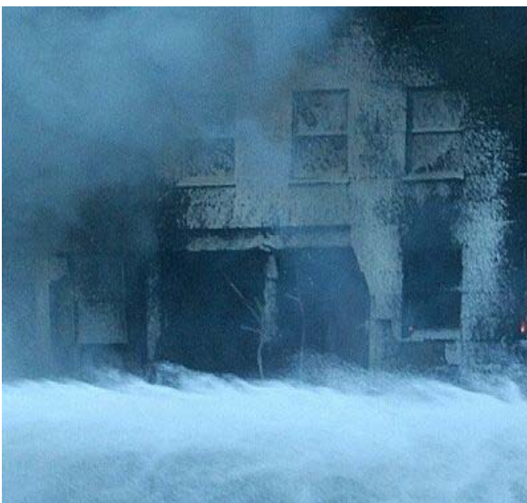
Ausschnitt aus Bild 2: Die Einschlagstelle (vergrößert dargestellt)

Das Objekt trat in die Wand des Pentagon genau hinter dem Hubschrauberlandeplatz ein. Eine halbe Stunde nach dem Angriff stürzte diese Außenwand ein (gegen 10.10 Uhr).