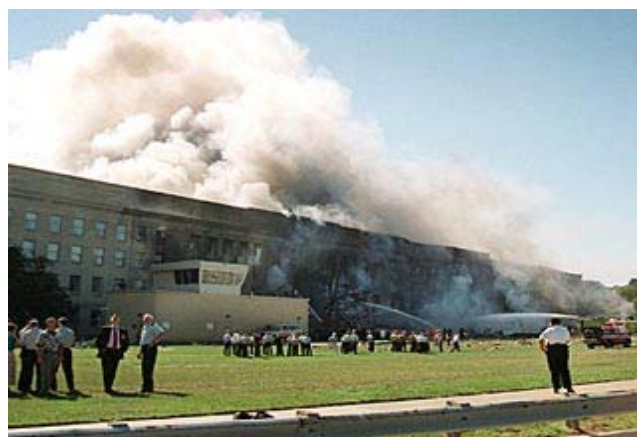
Bild1a: unmittelbar nach dem Einschlag: Wo sind denn die Flugzeugtrümmer?

Wir hörten etwas, was wie eine Rakete klang" ("We heard what sounded like a missile")